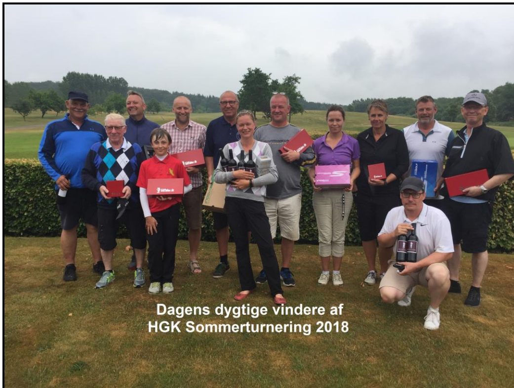
Dagens dygtige vindere af HGK Sommerturnering 2018

Tak til dagens sponsor (der havde valgt at være anonym) for flotte præmier